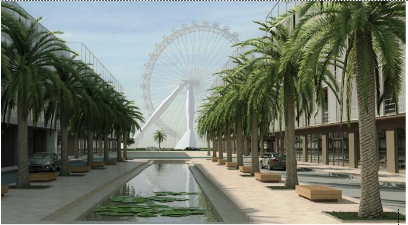
CALLE DE ACCESO A LA MARGINAL

Rabat es conocida como la ciudad de los empleados públicos, ya que todos los Ministerios, Gabinetes y Empresas Oficiales del Estado tienen allí su sede, sumando un total de 2,5 millones de habitantes en toda la Provincia. Teniendo como base estas cifras y esta realidad, el nuevo Master Plan tuvo en cuenta el desenvolvimiento de nuevas áreas urbanas dotadas de equipamientos Administrativos, Gubernamentales y Financieros, así como habitacionales.